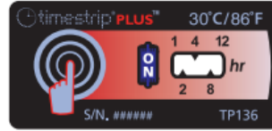
Activated Threshold not yet exceeded