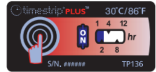
Activated Threshold temperature exceeded for more than 2 hours.